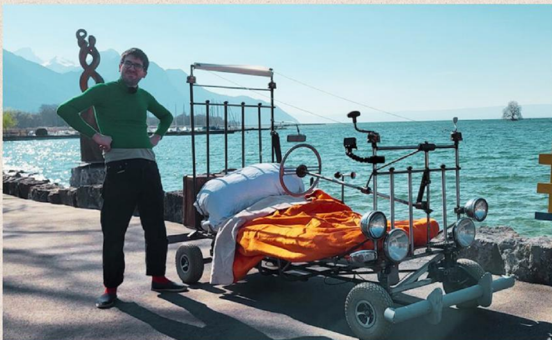
La Voiture-lit de Gaston.