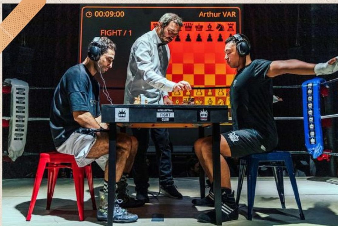
Un round d'échecs, au cours d'un match de chessboxing. L'échiquier est installé sur le ring. • © Yann Castanier / Hans Lucas - Intellectual Fight Club #2

« Le chessboxing m'est apparu comme le meilleur évaluateur de l'excellence de l'humain » racontait Enki Bilal en 2013.