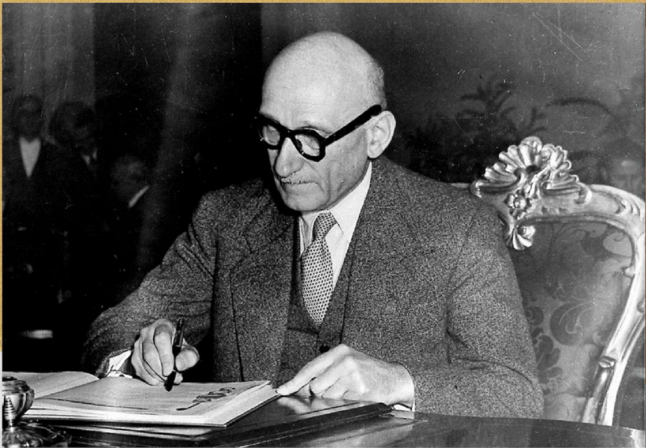
Source: Signature de la convention des droits de l'Homme par Robert Schuman, Rome.